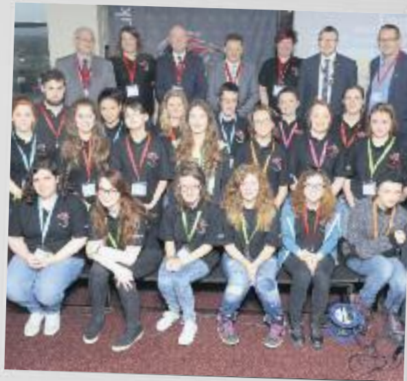
Cyngor Ieuenctid Sir Gar

Mae llawer o fwlis wedi dioddef o fwlio eu hunain. Credwn nad yw cosbi neu leihau buddiannau yn gweithio ar gyfer bwlis yn ein hysgolion ac y gall hyd yn oed hybu enw'r bwli. Yn lle cosbi, dylai ysgolion fod yn rhoi cymorth i fwlis a gweithio gyda nhw gan y gallai hyn rwystro'r bwlio wrth ei wraidd, yn hytrach na symud y bwlio i rywun arall.